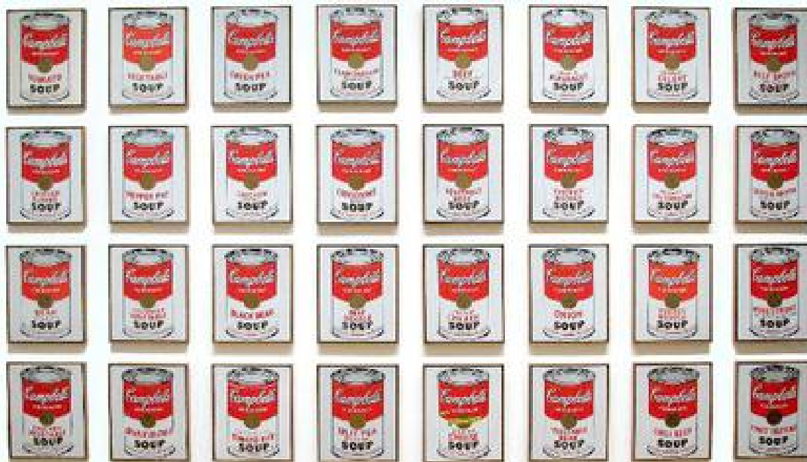
Campbell's Soup Cans (1962) par Andy Warhol.[efn_note] Source:

https://en.wikipedia.org/wiki/File:Campbells_Soup_Cans_MOMA.jpg#filelinks [/efn_note]