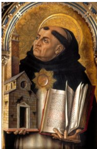
Santo Tomás de Aquino.

Un desafío permanente para el principio del destino universal de los bienes es la absolutización de la propiedad privada, especialmente cuando se trata de la privatización de alimentos y agua. Por un lado, la evidencia sugiere que la propiedad individual aumenta la probabilidad de que ésta sea mejor utilizada y cuidada que si es propiedad de un grupo. Siglos atrás, el famoso teólogo medieval católico romano Santo Tomás de Aquino escribió en su Summa Theologica que hay tres razones para favorecer la propiedad individual. Cuando un grupo posee algo, 1) los individuos tenderán a “eludir el trabajo y dejarlo a otro”, 2) “habría confusión si todos tuvieran que ocuparse de algo indefinidamente” y 3) “Las disputas surgen con mayor frecuencia donde no hay división de las cosas poseídas”. 4