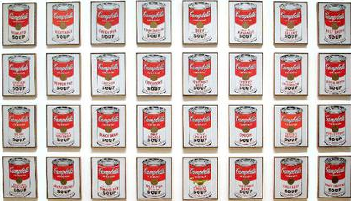
Latas de sopa Campbells (1962) de Andy Warhol. [efn_note]

Source: https://en.wikipedia.org/wiki/File:Campbells_Soup_Cans_MOMA.jpg#filelinks [/efn_note]