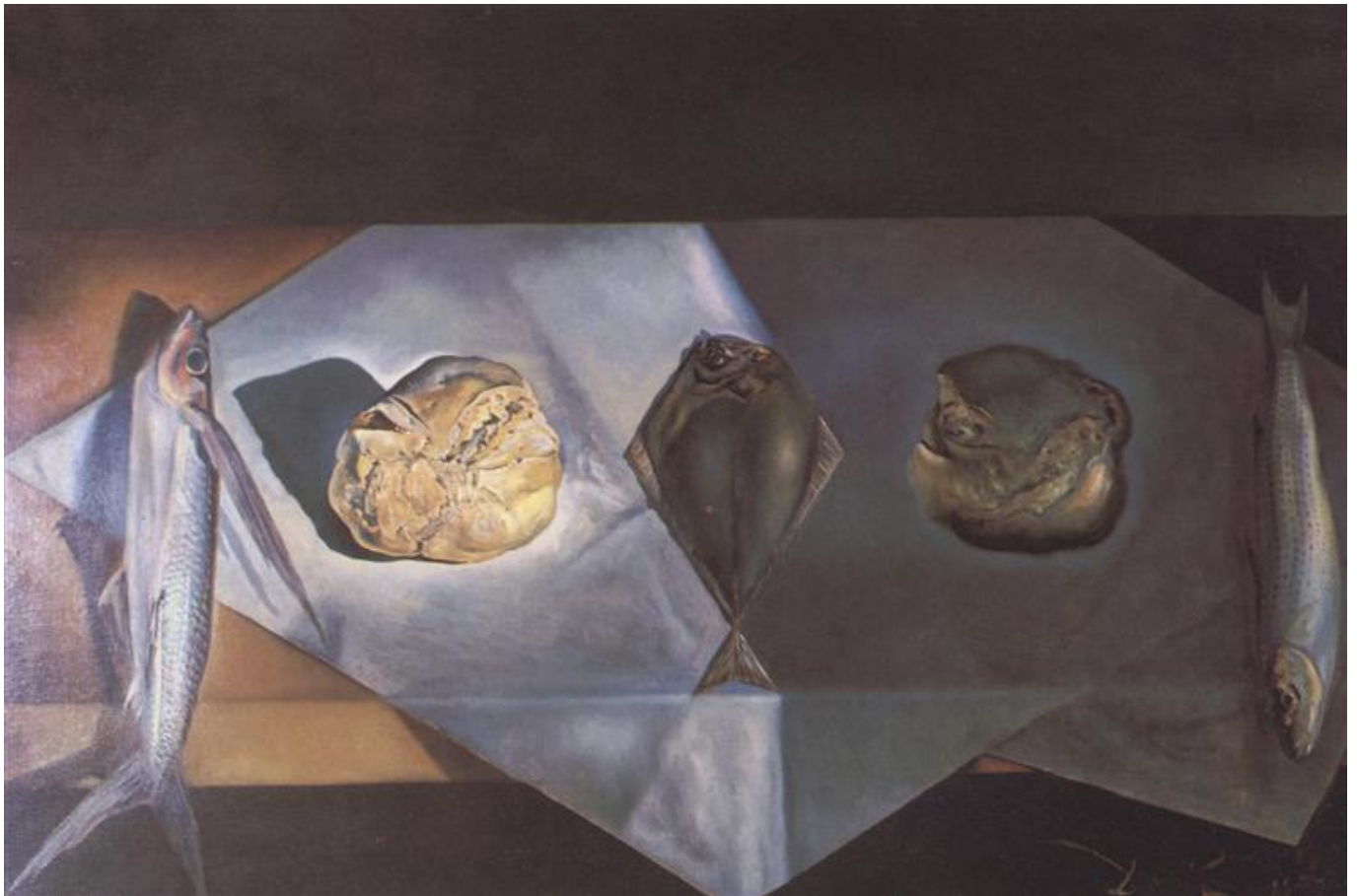
Naturaleza muerta eucarística, Salvador Dali, 1952. [efn_note]

En su pintura Naturaleza muerta eucarística , el artista Salvador Dalí pone tres peces pequeños, un erizo de mar y un trozo de pan sobre un mantel verde dorado iluminado por el cielo. Al igual que Neruda, Dalí está tratando de despertarnos al asombroso poder sagrado, incluso, en los alimentos más comunes.